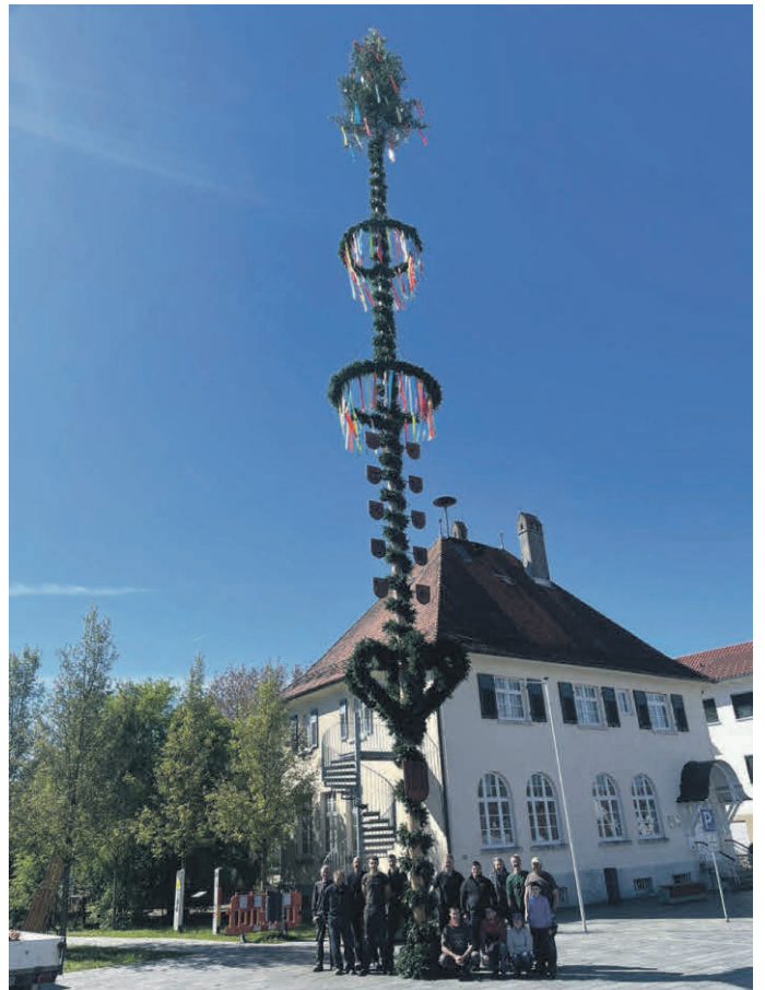
Arbeit verrichtet. Der Maibaum ist aufgestellt.