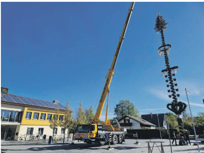
Aufstellung des Maibaums durch einen Kranwagen.