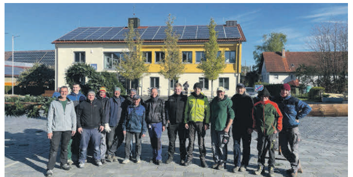
Gruppenfoto der zahlreichen Helfer.