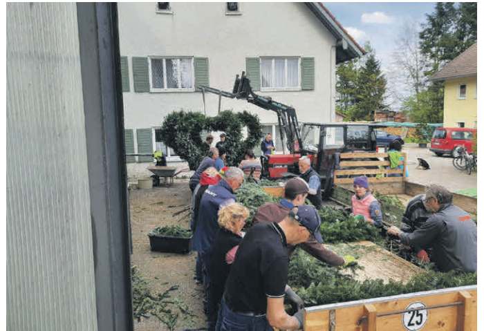
Der Tannenzweigschmuck wird in gemeinsamer Arbeit gefertigt.