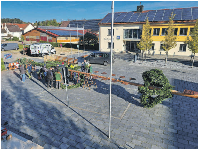
Der Maibaum wird zur Aufstellung vorbereitet.