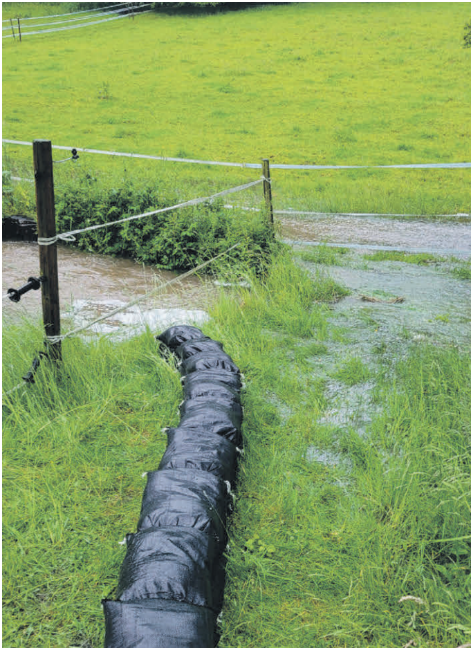
Schutz durch Sandsäcke im Bereich Tannenschorren.