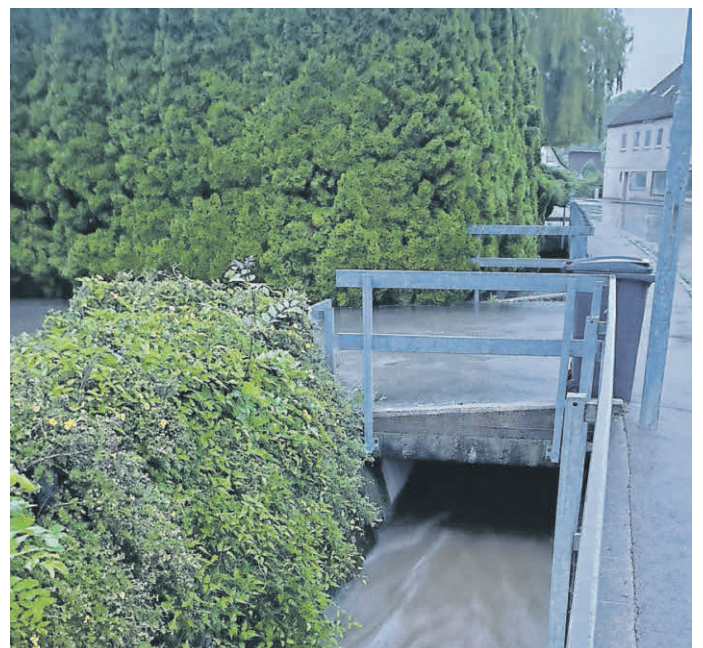
Bachlauf bei Metzgerei Kloos.

Es wird leider auch zukünftig mit Wetterphänomenen wie in den letzten Tagen zu rechnen sein. Daher ist es erforderlich, dass die vorhandenen Hochwasserschutzanlagen modernisiert bzw. angepasst werden und diese einer jährlichen Instandhaltung unterzogen werden. Hierbei geht es darum effektive sowie moderne Maßnahmen zu ergreifen und keine honorarsteigernden Lösungen umzusetzen.