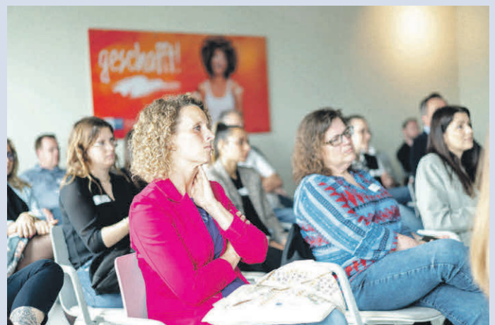
Das kompakte Blended-Learning-Konzept der Weiterbildung erfordert Eigenverantwortlichkeit und Disziplin. Dafür wird man mit Wissen belohnt.

Berufsbegleitender Fernlehrgang im Gesundheits- und Sozialwesen (djd). Unternehmen des Gesundheitswesens und der Sozialwirtschaft müssen immer wirtschaftlicher denken. Wer hier weiter vorankommen möchte, kann sich mit einem Fernlehrgang zum/zur Geprüften Fachwirt/in im Gesundheits- und Sozialwesen fortbilden und sich somit gute Karrierechancen sichern. Die Weiterbildung, die an der IHK-Akademie Koblenz angeboten wird, ist eine Kombination von Selbstlernphasen mit intensiver Betreuung durch Tutoren und Tutorinnen sowie ergänzenden Präsenzveranstaltungen. Nähere Informationen dazu findet man auf www.ihk-akademie-koblenz.de . Teilnehmende lernen, eigenständig komplexe fachliche und verantwortliche Aufgaben in entsprechenden Unternehmen und Einrichtungen wahrzunehmen, darunter zum Beispiel Planung, Führung, Organisation und Controlling.