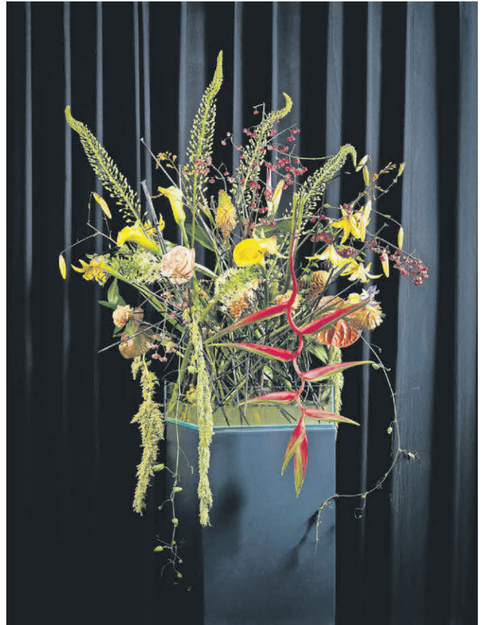
Gelb- und Rottöne dominieren in diesem sommerlichen Arrangement

Ernle: Gerne. Viele Grüße nach Tannheim!