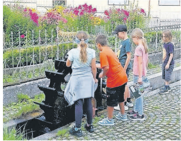
Schnitzeljagd-Station bei der Mühle Graf.

Am 21. August veranstaltete die Landjugend eine Schnitzeljagd durch Tannheim. Mit 20 Kindern ging es auf eine spannende Entdeckungstour, bei der Geschicklichkeit, Köpfchen und Teamarbeit gefragt waren. Nach dem Abenteuer ließen alle den Tag beim gemütlichen Grillen ausklingen - ein rundum gelungener Nachmittag!