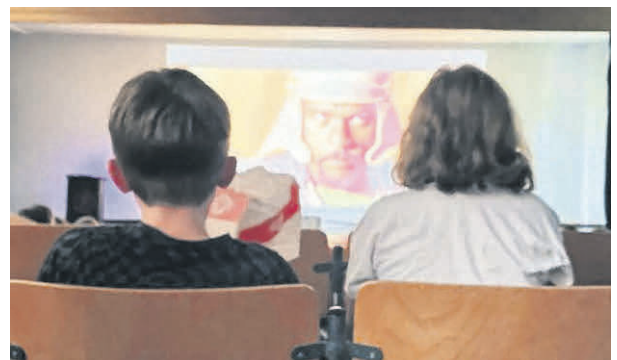
Gespannt verfolgen die Kinder die Vorstellung im Sommerkino.

An diesem Nachmittag verwandelte sich die Aula der Grundschule Tannheim in ein Kino. Rund 40 Kinder schauten gemeinsam „Astérix und Obélix bei den Ägyptern“ auf der großen Leinwand. Mit Popcorn und Limo bzw. Apfelschorle ausgestattet, verfolgten sie das Abenteuer der Gallier und erlebten einen unterhaltsamen Nachmittag mit Kino-Atmosphäre.