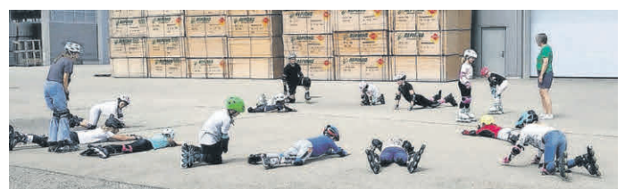
Vor dem Fahren steht richtiges Fallen auf dem Programm.

Bei diesem Programmpunkt galt es, seine Fähigkeiten im Inline-Fahren zu verbessern. Die Firma Lämmle stellte uns freundlicherweise ihr Gelände zur Verfügung und so wurde geübt, was Skater so alles können müssen. Nach einer kurzen Aufwärm-Übung ging es gleich mit dem Wichtigsten los: dem Fallen. Die Schoner wurden ausgiebig getestet und auch bei verschiedenen Übungen zum Bremsen und im Parcours glühten die Rollen.