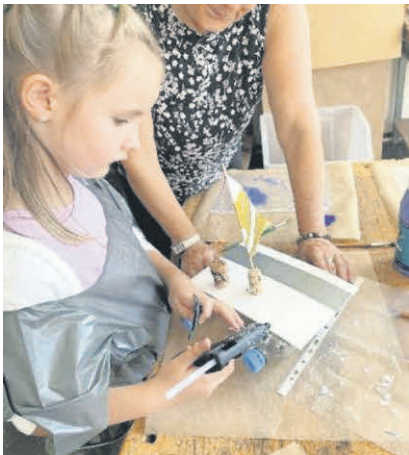
Beim Zusammenbauen der Katamarane wurde konzentriert gearbeitet.