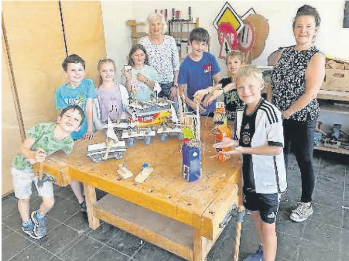
Gemeinsam bastelten die Kinder bunte Vogelfutterstellen und coole Katamarane.

Am 28. August durften die Kinder gleich dreifach kreativ werden. Unter der Anleitung der Betreuerinnen der verlässlichen Grundschule bastelten sie im Werkraum der Schule sowohl einen Katamaran als auch eine Vogelfutterstelle und ein kleines Katapult. Mit viel Eifer wurde gebohrt, geklebt und geschraubt, und am Ende konnte jedes Kind seine beiden Kunstwerke stolz mit nach Hause nehmen.