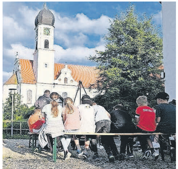
Gemütliches Grillen zum Abschluss des Ferienprogramms mit der Landjugend.