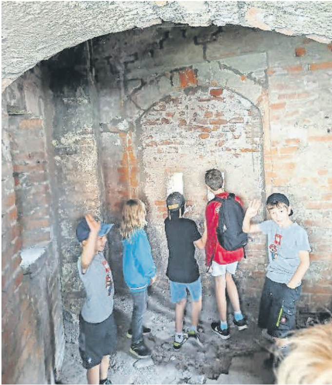
Mutige Entdecker/innen ließen sich kurz ins Verlies einschließen, wurden wegen gutem Betragen aber wieder freigelassen.

Am 8. August erkundeten 19 Kinder und ihre Begleiter/innen bei einer spannenden Kinderstadtführung Memmingen. Die Stadtführerin Frau Stölzle erzählte faszinierende Geschichten aus dem Mittelalter und führte die Kinder zu verschiedenen historischen Orten, darunter die Stadtmauer und den Kreuzherren Saal. Nach dieser 1,5-stündigen aufregenden Entdeckungstour folgte als Belohnung ein Eis und ein Spielplatzbesuch.