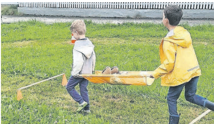
Kuschtierparcours mit Notfall-Patient.