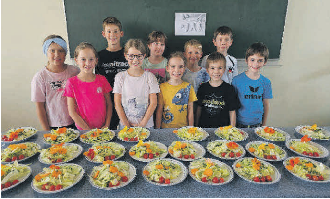
Unsere stolzen Kochprofis.

Der Frauenbund eröffnete an diesem Tag mit 10 Kindern das Kinderrestaurant LECKER SCHMECKER. Man kochte in kleinen Gruppen ein 3-Gänge Menü und mixte einen Cocktail für die Küchen-Crew und die Gäste. Nach dem Tischdecken kamen die Gäste der Kinder an und wurden mit dem Begrüßungscocktail empfangen. Schon wurde das gezauberte Menü serviert und alle ließen es sich gemeinsam schmecken. Lecker war's!