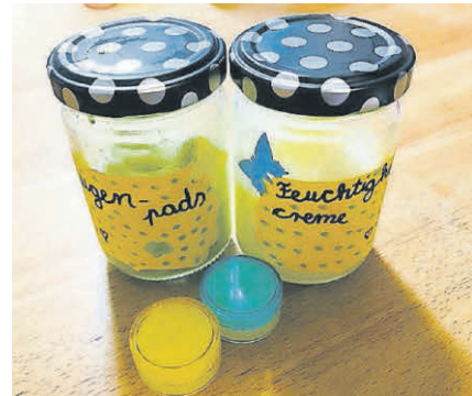
Naturkosmetik wie Augenpads und Feuchtigkeitscreme stellten die Kinder selbst her.