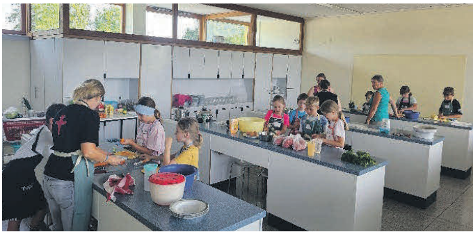
Alle fleißig am Kochen.