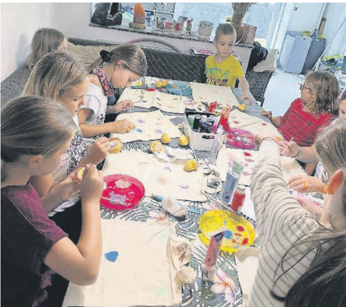
Doch auch den älteren Tannheimer Kids gefällt das Basteln sehr.