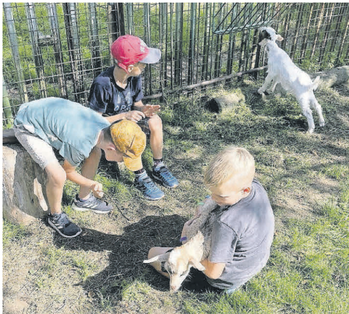
Kleine Zicklein genießen die Streicheleinheiten.