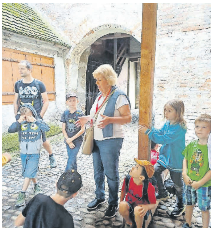
Die Stadtführerin erzählt vom mittelalterlichen Memmingen und dem Vergleich zur Neuzeit.