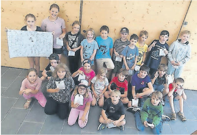
Spielspaß mit der Narrenzunft.

Am 26. Juli lud die Narrenzunft Tannheim wieder zu einem tollen Spielprogramm ein. 22 Kinder verbrachten den Vormittag voller Freude und Teamgeist. In kleinen Gruppen traten sie gegeneinander an und konnten dabei ihrer Kreativität freien Lauf lassen. Der Tag war voller Spannung, Freude und lachenden Gesichtern - ein gelungener Start in die Sommerferien!