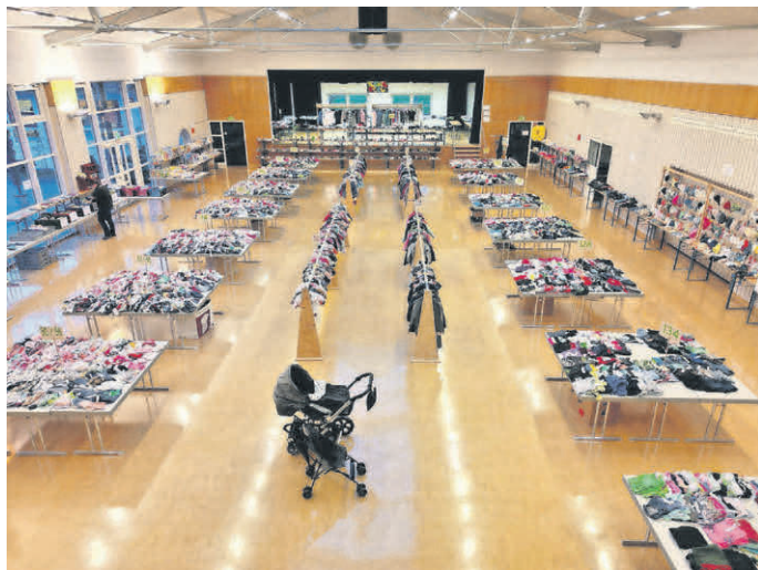
Die Ware im Dorfgemeinschaftshaus wartet auf die Käufer