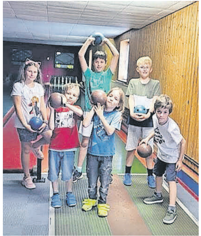
Die VdK-Kegelrunde fieberte bei jedem Wurf mit.

Am Nachmittag des 8. August machte sich der VdK mit sechs Kindern auf den Weg nach Ferthofen, um zwei Stunden auf der Kegelbahn beim Bruckwirt zu verbringen. Mit großer Begeisterung versuchten die Kinder, die Kugeln ins „Volle“ zu schieben. Zur Halbzeit gab es Pommes und Getränke, und nach aufregenden Kegelspielen ging es am Ende mit strahlenden Gesichtern zurück nach Tannheim.