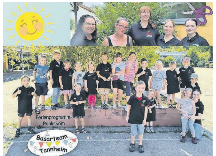
Das Basarteam und ihre Teilnehmer hatten sichtlich Spaß im Sonnenschein.

Das Basarteam Tannheim gestaltete am 5. August gemeinsam mit knapp 20 Kindern individuelle „Mensch-Ärgere-Dich-Nicht“-Spielbeutel. Die Kinder nähten und gestalteten mit Begeisterung die Spielsteine sowie die Beutel. Zwischendurch gab es eine kleine Stärkung mit Brezeln und Capri Sun. Es war ein kreativer Nachmittag, der allen viel Freude bereitet.