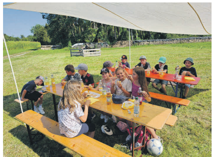
Stärkung vom Grill