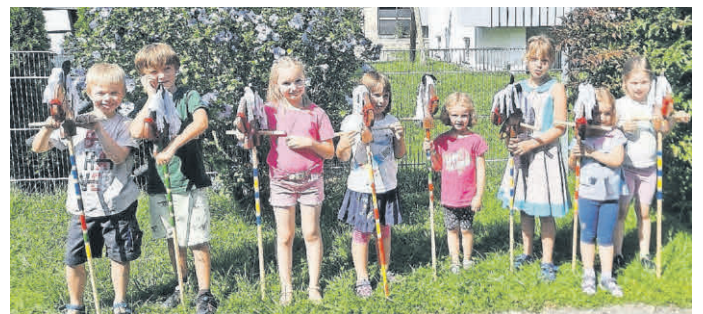
Die Reiter/innen posieren mit ihren Pferdchen.

Das Kinder- und Familienzentrum „Zum guten Hirten“ organisierte für die Kinder das Gestalten eines Steckenpferdes. In zwei Kleingruppen entstanden so 16 individuelle und ganz bunt bemalte Steckenpferde, die am Ende des Vormittags im Galopp nach Hause ritten.