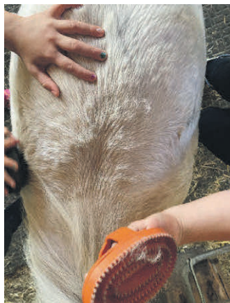
Auch das Striegeln gehört zum Reiten dazu.

Ein Pferdeerlebnistag in Legau stand am 28. August für sechs Kinder auf dem Programm. Dabei durften sie Einiges über die Pferdehaltung sowie die Fütterung der Tiere erfahren und absolvierten gemeinsam mit den Ponys einen Parcours auf dem Reitplatz. Nachdem sie ein Gefühl für die Ponys hatten, ging es mit Begleitung hoch zu Ross über den Reitplatz – das Highlight des Tages.