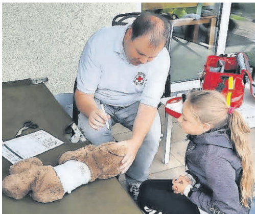
Untersuchung der Kuschtiere zusammen mit den Kindern.

Bei einer ausgiebigen Anamnese wurde herausgefunden, was den Kuschtieren der Kinder genau fehlte. Während der Behandlung untersuchten die Kinder ihre Plüschpatienten gründlich - sie tasteten ab, hörten ab, nahmen „Blut ab“, gaben Spritzen, maßen Fieber und legten Verbände an. Anschließend durften die Kinder einen Trageparcours absolvieren. Wir hoffen, dass alle Kuschtiere nun wieder wohlauf sind!