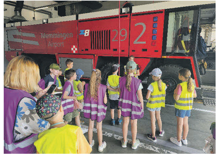
Bei der Flughafen-Feuerwehr

Am 7. August ging es mit dem Frauenbund und elf Kindern nach Memmingen zum Flughafen, wo echte Urlaubsgefühle aufkamen. Vom Aufgeben der Koffer bis hin zur Sicherheitskontrolle erlebten die Teilnehmenden alles hautnah und auch das Starten und Landen der Flugzeuge konnte aus nächster Nähe beobachtet werden. Schließlich gab es eine Führung mit der Feuerwehr mit Probefahren im großen Löschfahrzeug, was für kleine und große Tannheimer für Begeisterung sorgte.