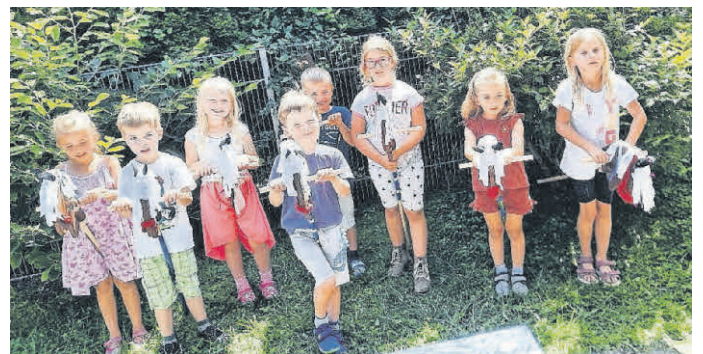
Viele glückliche Steckenpferde und Besitzer.