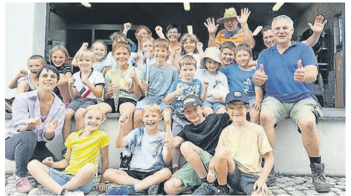
Die Kinder mit Begleiter/innen und Herrn Igel vor der Maschinenhalle der Kläranlage.