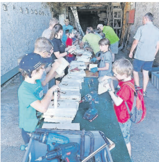
Konzentriert werden die Bausätze zuvor zusammengebaut.