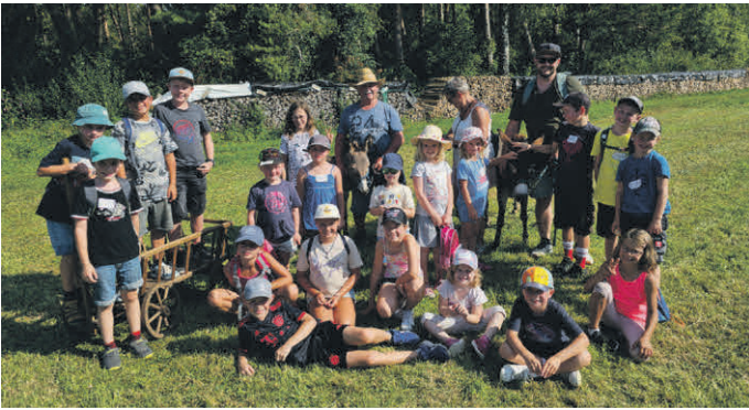
Eine tolle Truppe