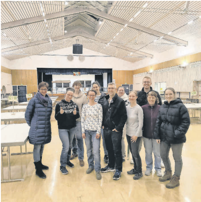
„Das derzeitige Basarteam“