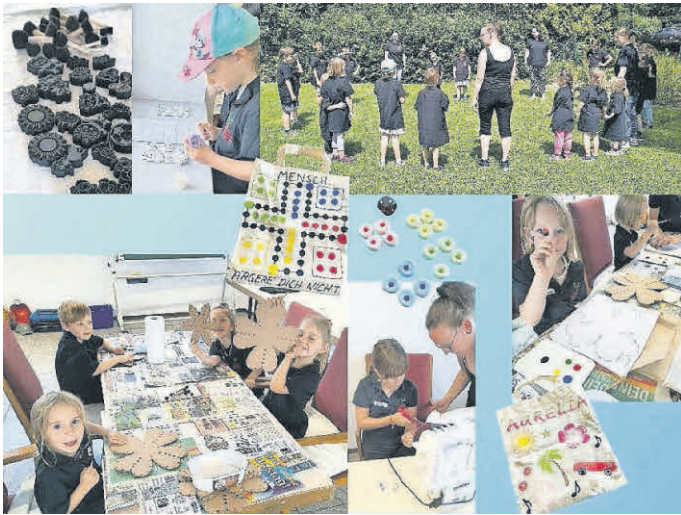
Die Mensch-Ärgere-Dich-Nicht Taschen wurden bedruckt, genäht und bemalt.