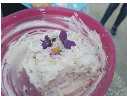
Wildkräuterfrischkäse mit Blüten