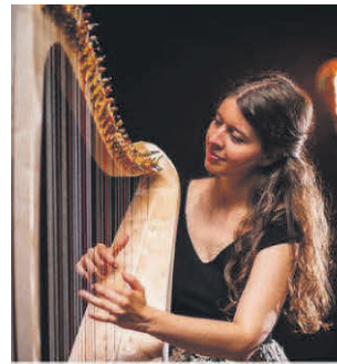
AURELIA - Harfe & Gesang Samstag 05. April 2025, 20:00 Uhr Eintritt: 15 Euro (ermäßigt 10,- Euro) Kirche - St. Petrus in Ketten Rot/Haslach

Samstag, 5. April um 20.00 Uhr Kirche St. Petrus in Ketten in Haslach Eintritt: 15 Euro (ermäßigt 10,00 Euro)