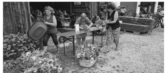
Die fleißigen Helferinnen bei der Arbeit