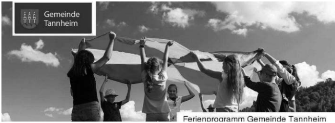
Ferienprogramm Gemeinde Tannheim