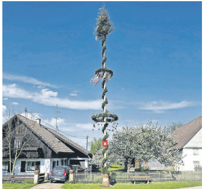
Tannheim-Arlach: Der Maibaum ist aufgestellt.