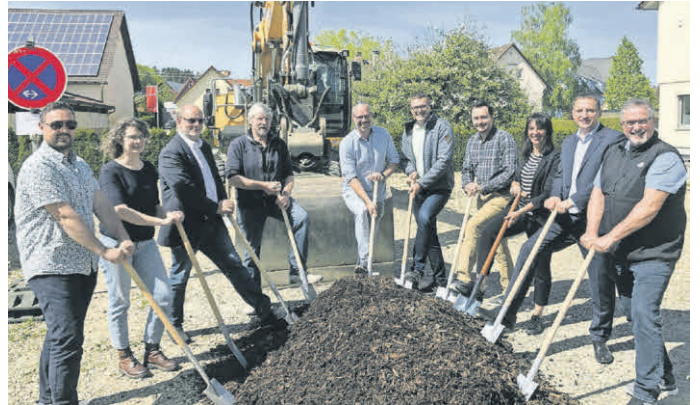
Spatenstich zum Projekt „Rathausplatz 2“.

Neben der Errichtung des Pavillons werden auf dem Areal 4 PKW-Stellplätze, Kinderspielgeräte, Bewegungsgeräte für Erwachsene und Sitzbänke errichtet. Der Gemeinderat wird noch über die genaue Gestaltung des Platzes beschließen. Die Kosten für die Errichtung des Pavillons sowie die Freiflächengestaltung einschließlich Planungskosten belaufen sich auf ca. 430.000 €. An Zuschüssen aus dem Bund- Länder-Förderprogramm „Kleinere Städte und Gemeinden - LRP“ erwartet die Gemeinde ca. 100.000 €. Es wird derzeit damit gerechnet, dass das Vorhaben Ende dieses Jahres fertiggestellt sein wird. Nach Fertigstellung soll es eine Einweihung im Rahmen eines Rathausplatzfestes geben, so der Bürgermeister.