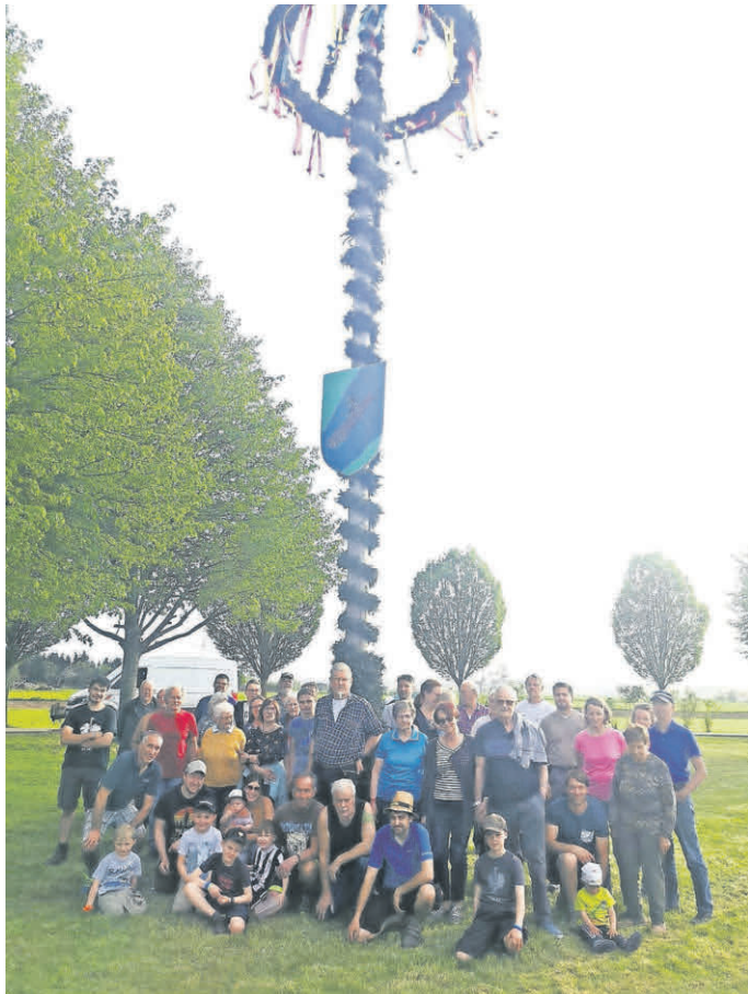
Tannheim-Egelsee: Gruppenfoto der zahlreichen Helfer.