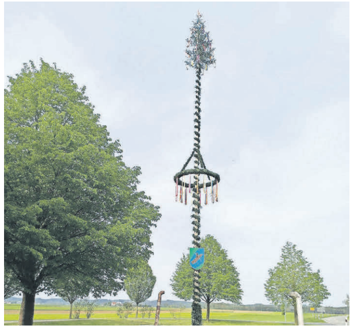
Tannheim-Egelsee: Der Maibaum ist aufgestellt.