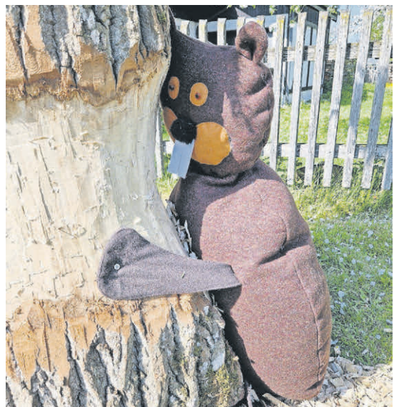
Tannheim-Arlach: Ein origineller Biber am Maibaum.