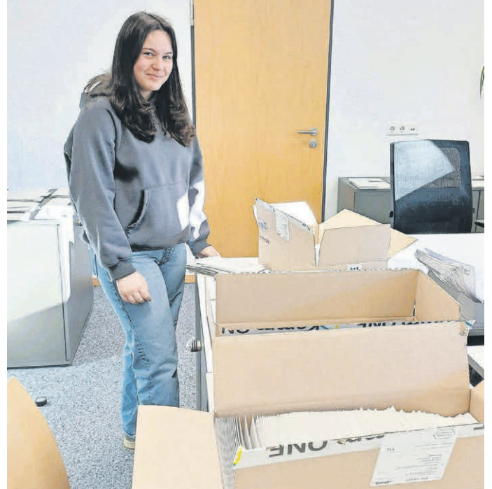
Die Achtklässlerin schnuppert für einen Tag Verwaltungs-Luft im Rathaus.